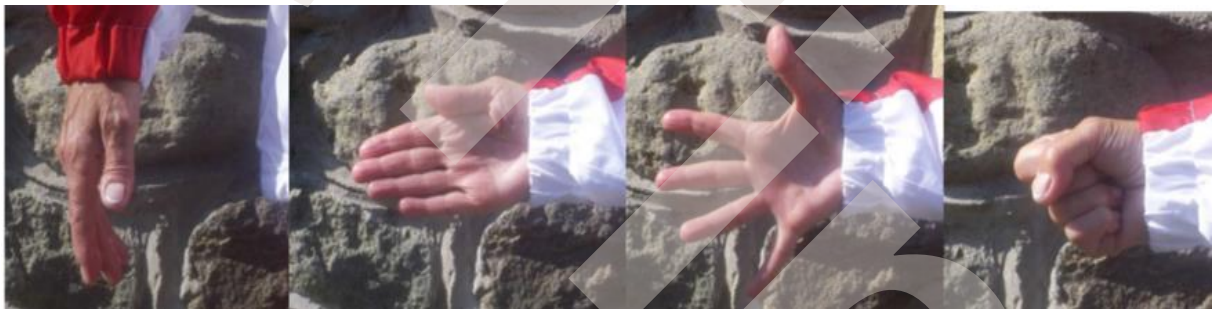
( 1. ábra)